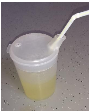
Abb.4 Tipp: Schnabelbecher stabilisiert Strohalm