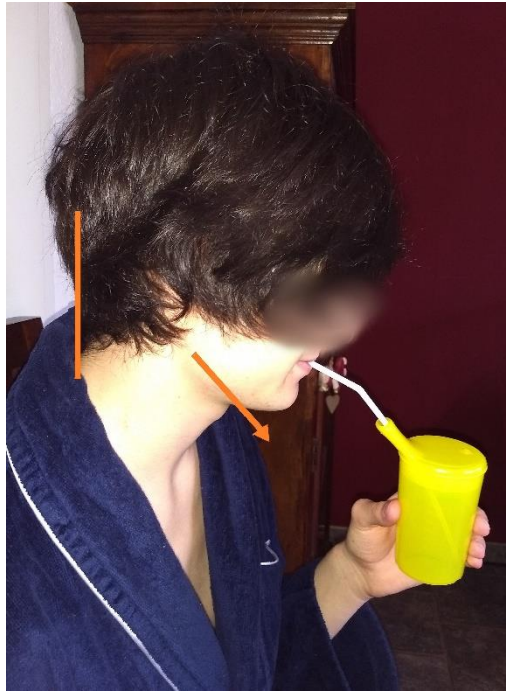
Abb 1 Günstige Kopfhaltung: langer Nacken, geneigtes Kinn