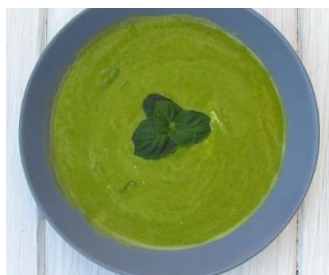
Abb.7 Auch Schluckdiät kann ansprechend sein 😊