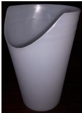
Abb.2 und 3 Nasenausschnittbecher